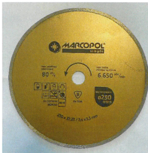
Ściernica z nasypem diamentowym ciągłym / Cutting-off wheel with continuous diamond rim 230×22,23/2,4×5,5

Załącznik stanowi integralną część Certyfikatu Nr B-046/22. This Attachment forms an integral part of the Certificate No. B-046/22.